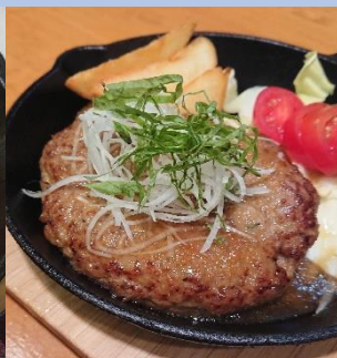
手ごねハンバーグ