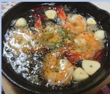
海老のアヒージョ