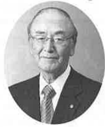
日本商工会議所 会頭 三村明夫

明けましておめでとうございます。2020年の新春を迎え、謹んでお慶び申し上げます。