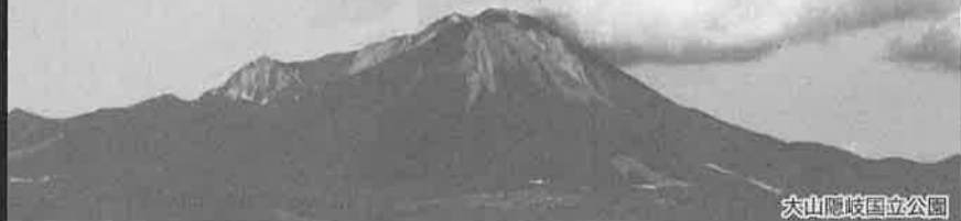
大山隠岐国立公園