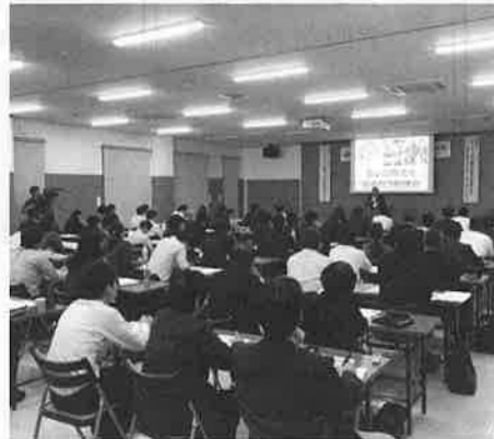
第一回島根県まちゼミフォーラム in 安来