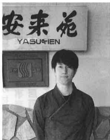
■(株)安来苑 〒692-0064 安来市古川町478 tel.0854-28-6262

【(株)安来苑】 お食事処の玄関にはドジョウ掬いの頭が軒下まである大きなお面があり、陽気な顔でお