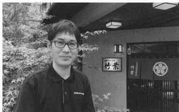
■竹葉 〒692-0064 安来市古川町438 tel.0854-28-6231 HP: https://www.chikuyou.jp/ Instagram、Facebook、Twitterも更新中

その状況となりませんが、「目に見えないものに怯えて怖がるより安心・安全を確保してお客様をお迎える努力をしていきたい」と感染防止対策にも取り組んでおられます。 最近、ホームページも新しくされ竹葉の魅力を発信されていますので、覗いてみられてはいかがでしょうか？