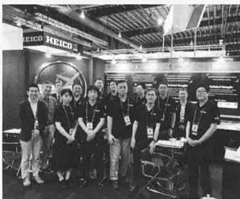
シンガポールエアショー