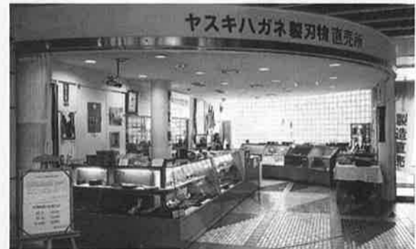
ヤスキハガネ製刃物直売所 (和鋼博物館内) 〒692-0011 安来市安来町1058 / TEL.0854-23-0503 営業時間/10:00~15:00 定休日/水曜日(水曜日が祝日の場合は翌木曜日)