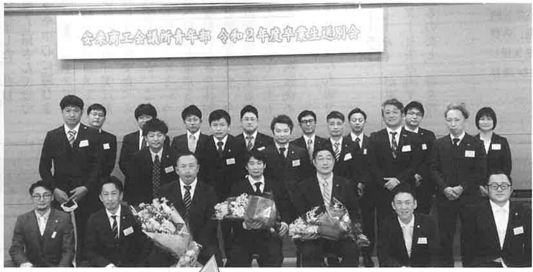
安来商工会議所青年部 令和2年度卒業生送別会

議事の方では、令和2年度事業報告・収支決算の承認及び令和3年度事業計画・収支予算案について承認を得ました。 その後、卒業生送別会を行い、6名の方が卒業されました。卒業生の中には3人の会長経験者や、22年間という長きにわたり青年部に御尽力頂いた方々もおられ、大変想いのあること、笑いあり感動ありの送別会になったと思います。