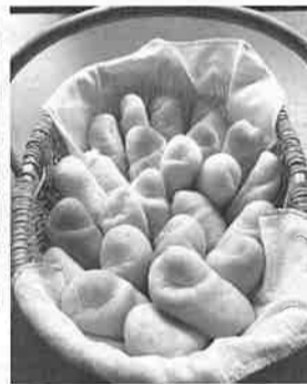
【10月】 原料にこだわった 特製塩パン