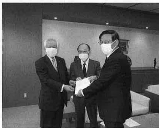
市長へ要望書提出