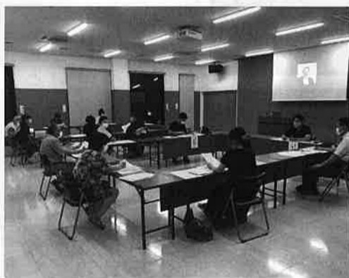
まちゼミ結果検証会&ブラッシュアップ研修会