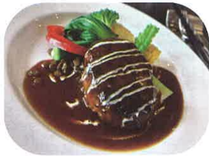
人気メニューのハンバーグ

店内も広々と座席の間隔を空け、小さいお子様連れのお客様にも安心してご利用いただけるよう個室をご用意。寛いだ空間でお食事をしていただきたいと思っております。