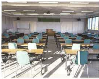
視聴覚室は最大120名で使用可能

収容でき、教室も目的に合わせて複数あるので、会議や研修で会場をお貸ししています。屋外から直接中へ車や機械を搬入できる実習室もあり、安全大会や催し物など、様々な用途で地域の皆様に有効活用していただける施設です。