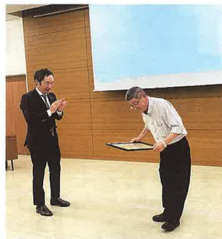
並河会頭より表彰状を授与されました

日本商工会議所より、永年にわたり安来商工会議所の役員・議員として会員企業の繁栄、地域経済の振興に力を尽くされた功労が称えられ、3名の方が表彰されました。