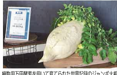
植物用万田酵素を用いて育てられた世界記録のジャンボ大根