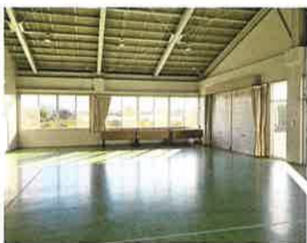
大きな搬入口のある実習室