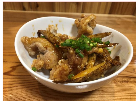
チキンチキンごぼう