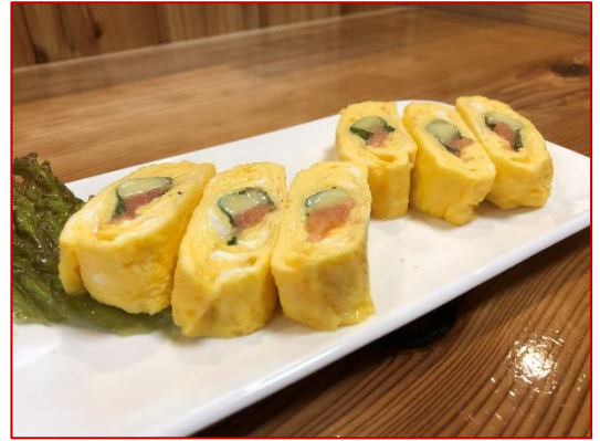
明太チーズ玉子焼き